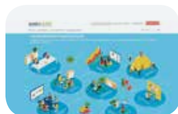
Cité des entreprises et de la santé au travail